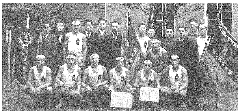
昭和24年11月23日 第29回 河北潟一周駅伝優勝英田チーム